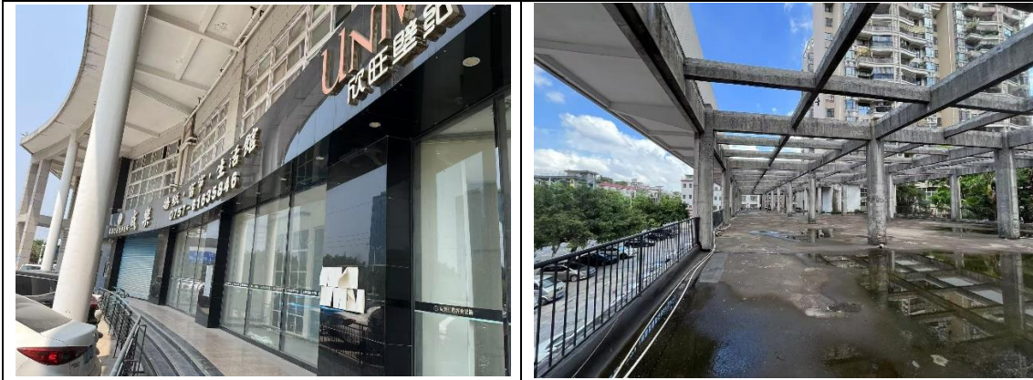
5. 禅城区文华中路 28 号力迅上筑小区住宅底商